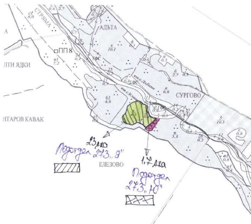
Схема на Ветрован-Ветровани в Тополовци муниципалитети.